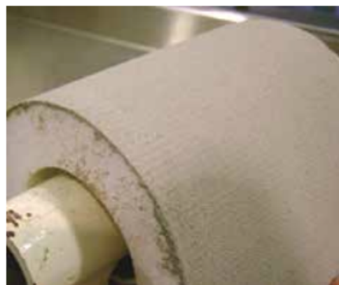
Prueba de Resistencia a la Flexión sin Agrietamiento